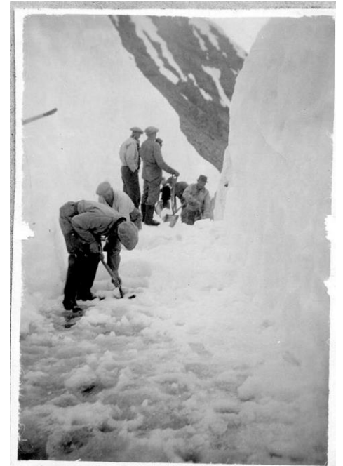
Breiðdalsheiði í júlí 1944